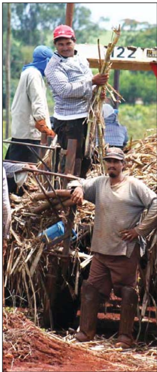
Trabajadores de plantación de caña de azúcar recogen la cosecha del próximo año en Brasil.

País posee condiciones para ampliar producción de biocombustibles.