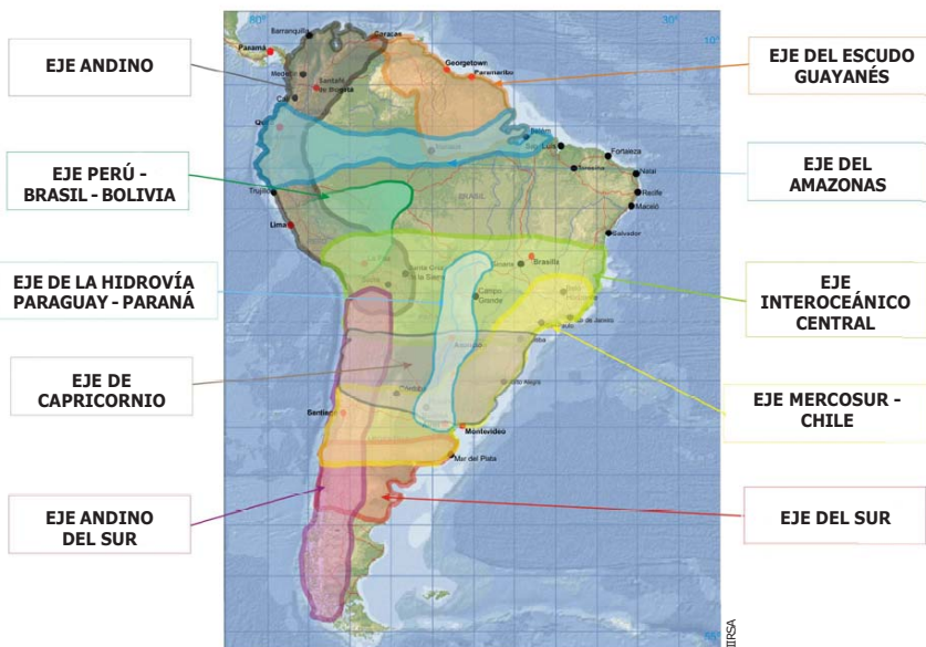
IIRSA: Ejes de integración y desarrollo

Uno de los megaproyectos definidos en la Agenda Consensuada de IIRSA es el Corredor Vial Interoceánico Sur Perú-Brasil, o Carretera Interoceánica Sur, cuyo asfaltado en el Perú se inició en el 2005 a un costo de más de $1 millardo, y que posibilitará el acceso de los estados brasileños de Acre y Rondônia a